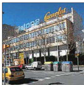
Fábrica de Cacaolat

■ La Fiscalía considera que el concurso de acreedores de Cacaolat, que tramita el juzgado de lo mercantil 6 de Barcelona, no debe acumularse al de Clesa, empresa láctea propietaria del 95% de la firma de batidos y cuyo procedimiento concursal lleva el juzgado de lo mercantil 6 de Madrid. / Redacción